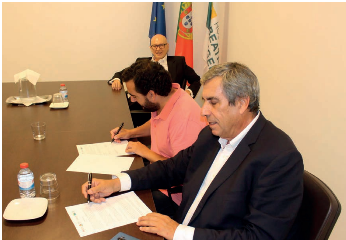
8 agosto/2023 Assinatura AE Hospital Beatriz Angelo - Loures