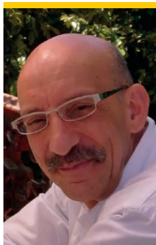
Médico de Família USF de S. Torcato