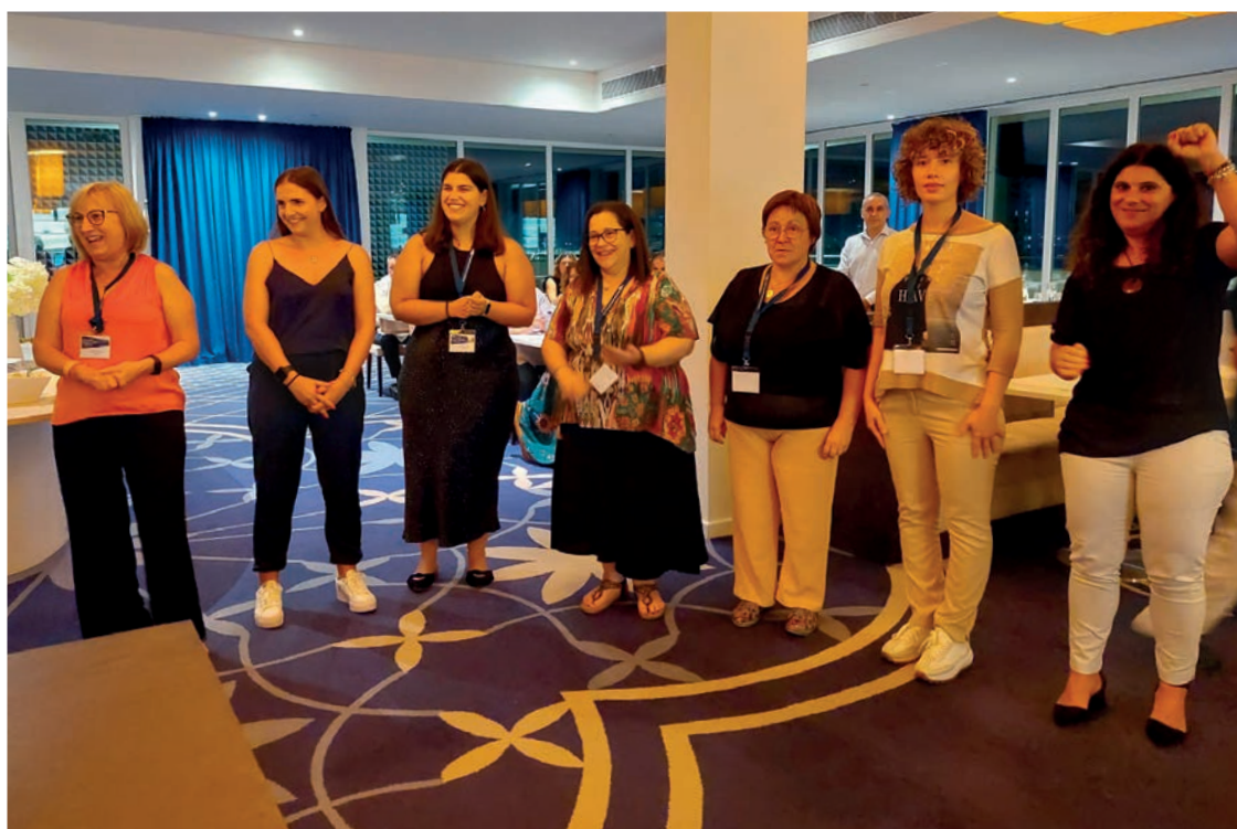
A equipa do SIM