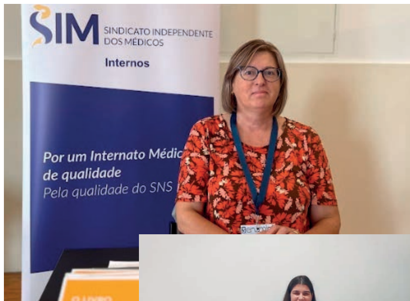
Presença do SIM em eventos dos Médicos Internos