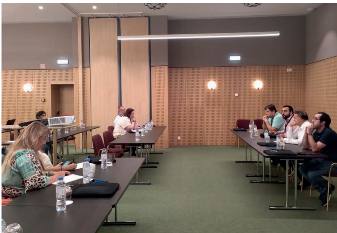
15 a 17 setembro/2023 Convenção de Dirigentes e Delegados Sindicais do SIM Alentejo e SIM Algarve