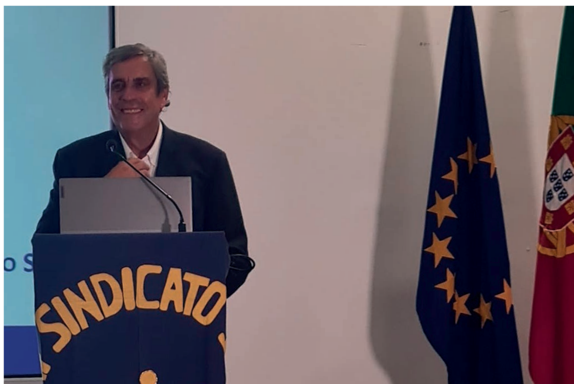
Sessão de encerramento V Convenção do SIM