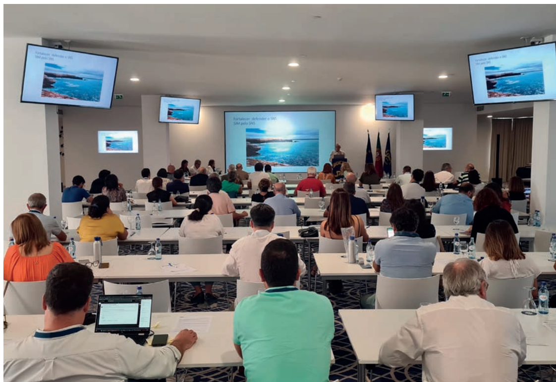
7 outubro/2023 Decorrer dos trabalhos